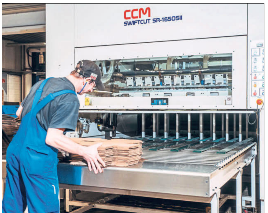
1000 Verpackungen mehr schafft diese neue Maschine am Tag.